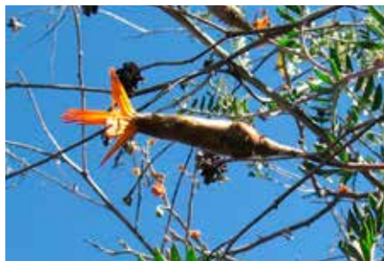
Mutisia acuminata Ruiz & Pav.