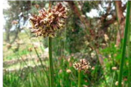
Schoenoplectus californicus (C.A. Mey.) Soják