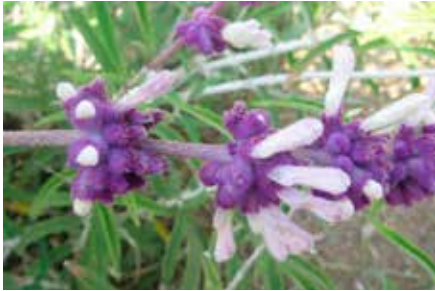
Salvia leucantha Cav.