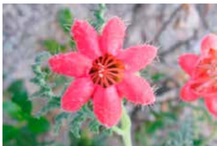
Caiophora deserticola Weigend. & M. Ackermann.