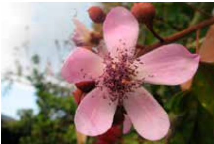
Bixa orellana L.