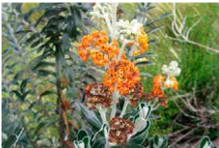
Buddleja coriacea Remy