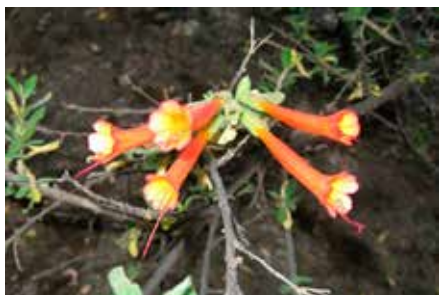
Cantua buxifolia Juss