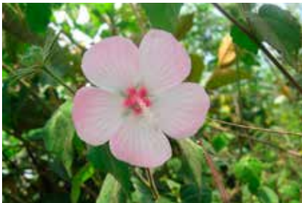
Urena lobata L.