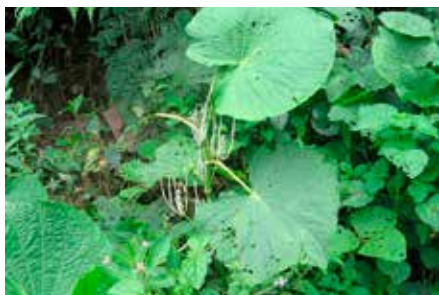
Piper umbellatum L.