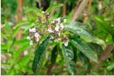
Aloysia citrodora Palau