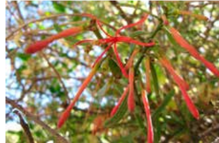
Ligaria cuneifolia (Ruiz & Pav.) Tiegh