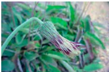
Chaptalia nutans (L.) Polakowski.