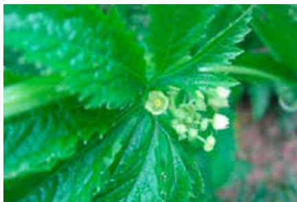
Cyclanthera pedata (L.) Schrad