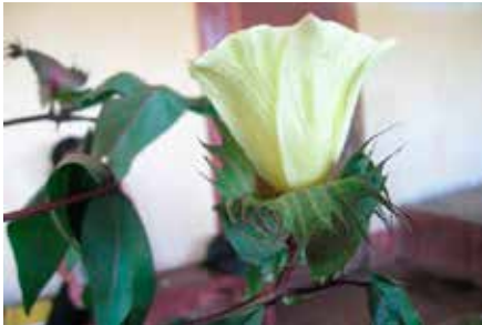
Gossypium barbadense L.