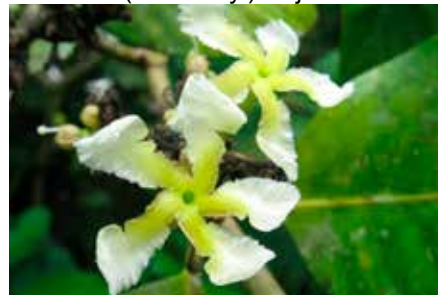
Tabernaemontana sananho Ruiz & Pav.