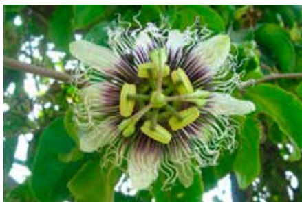
Passiflora edulis Sims