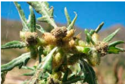
Xanthium spinosum L.