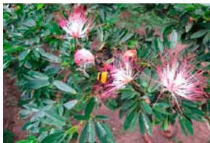
Calliandra angustifolia Spruce ex Benth.