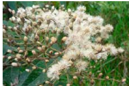
Vernonia patens (Kunth) H. Rob.