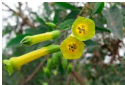
Nicotiana glauca Graham