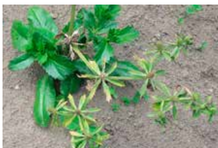
Eryngium foetidum L.