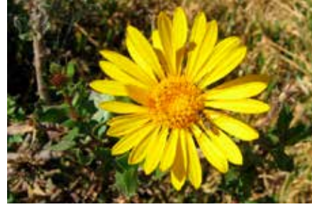
Grindelia tarapacana Phil.