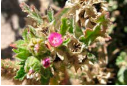
Fuertesimalva echinata (C. Presl) Fryxell