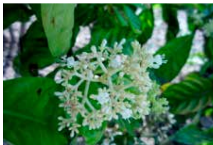
Psychotria viridis Ruiz & Pav.