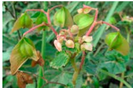
Begonia fischeri Schrank