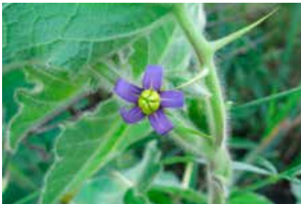
Solanum mammosum L.