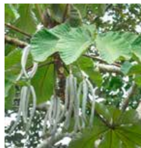
Cecropia engleriana Snethl.