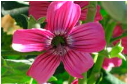
Lavatera assurgentiflora Kellogg