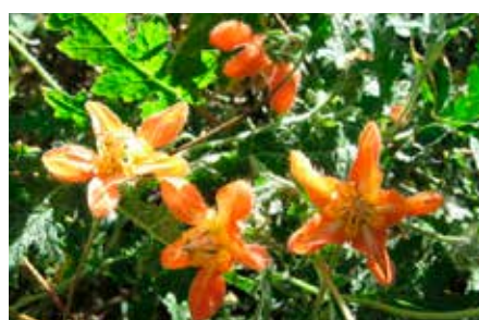
Caiophora cirsiifolia C. Presl