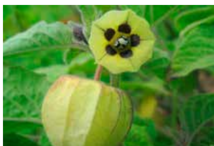
Physalis peruviana L.