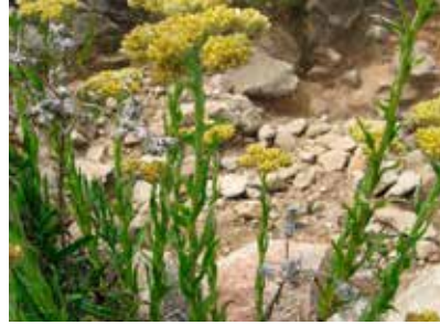
Gnaphalium dombeyanum DC.