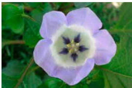
Nicandra physalodes (L.) Gaertn.