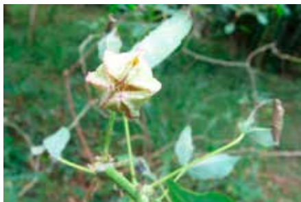
Manihot esculenta Crantz