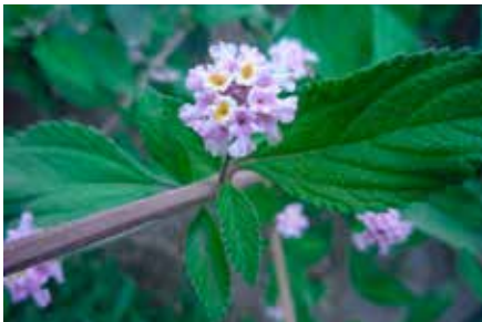
Lippia alba (Mill.) N.E. Br.