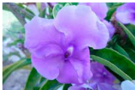
Brunfelsia grandiflora D. Don