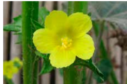
Malachra alceifolia Jacq.