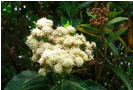
Baccharis latifolia (Ruiz & Pav.) Pers.