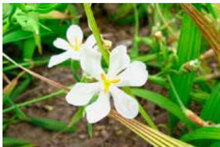
Eleutherine bulbosa (Mill.) Urb.