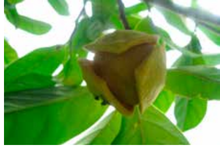
Annona muricata L.