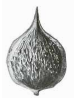
Buart-Walnuss ( Juglans x bixbyi ).