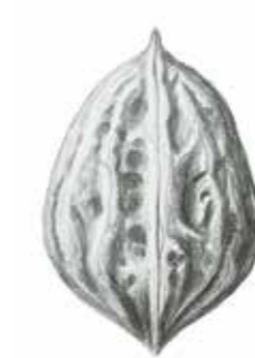
Chinesische Butternuss ( Juglans cathayensis ).