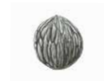
Felsenuss ( Juglans microcarpa ).