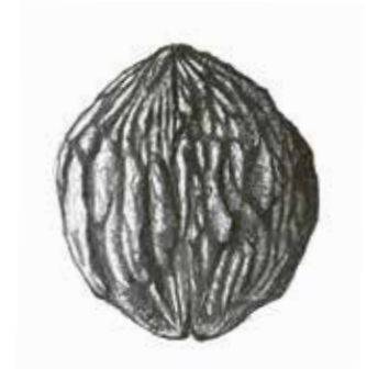
Schwarznuss ( Juglans nigra ).