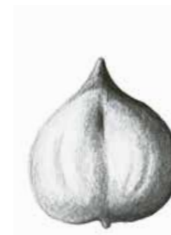
Herznuss ( Juglans ailantifolia v. cordiformis ).