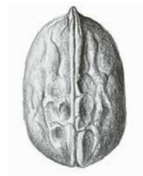
Echte Walnuss ( Juglans regia ).