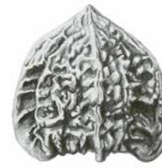
Chinesische Sammler-Walnuss ( Juglans hopeiensis ).