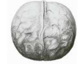
Paradox-Hybridnuss ( Juglans x 'Paradox').