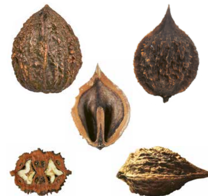
Juglans x bixbyi (links oben) und var. lancastriensis , Nüsse, Schalenhälfte und Querschnitt.