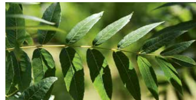
Blätter und Nüsse verschiedener Bäume dieser Hybriden. Die Variabilität ist sehr groß.