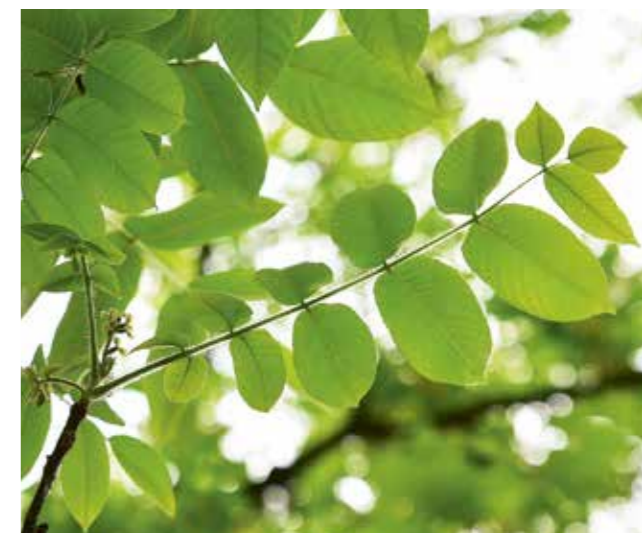
Blatt im Frühling, weiblicher Blütenstand.