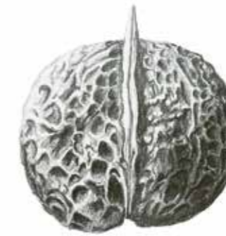
Yangbi-Walnuss ( Juglans sigillata ).