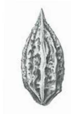
Mandschurische Walnuss ( Juglans mandshurica ).

Juglans sigillata Dode, Yangbi-Walnuss (China, Indien; teilweise als Synonym/Unterart von J. regia gewertet)