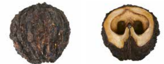
Nuss und Schalenhälfte (Originalgröße).