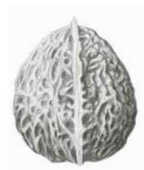
China-Hybridnuss ( Juglans x sinensis ).