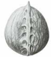
Japanische Walnuss ( Juglans ailantifolia ).