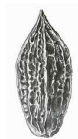
Butternuss ( Juglans cinerea ).

Illustrationen von Nüssen der Gattung Juglans (Originalgröße).