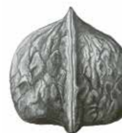
Hybridnuss ( Juglans x intermedia ).