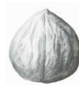
Hinds-Walnuss ( Juglans hindsii ).