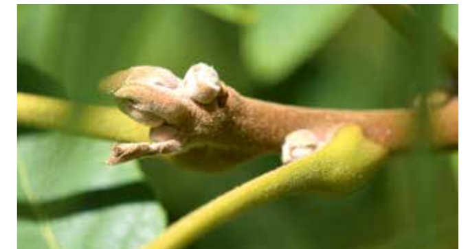
Knospe im Sommer.