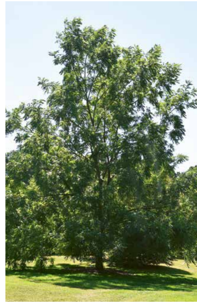
Typischer Habitus im Arboretum Wespelaar, Belgien.

Diese Hybriden sind meist durch Zufall entstanden und als ihre Elternarten beschriftet. Weil diese Schwarznüsse in Nuss- und Blattgröße variabel sind, ist die Bestimmung relativ schwer. Es ist nur selten klar eruierbar, ob neben der Schwarznuß die Arizona-Schwarznuß oder die Felsennuß beteiligt ist. Es gibt auch natürliche Hybriden zwischen J. major und J. microcarpa .