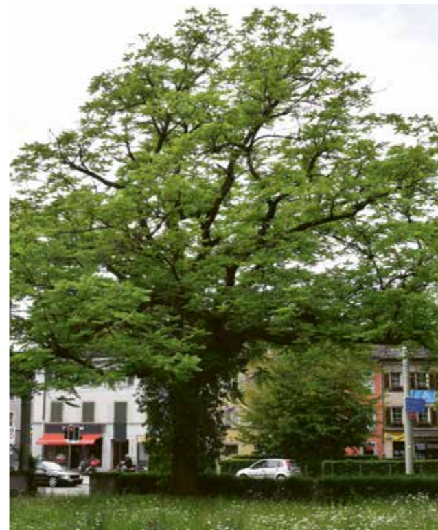
Habitus beim Haus zur Platane, Winterthur.

Der Botaniker Alfred Rehder hat mit Juglans x bixbyi eine Hybride der Nominatform der Japanischen Walnuss mit der Butternuss bezeichnet. Heute wird in der Nusszucht das Taxon für die Butter-Herznuss-Hybride verwendet, die Rehder J. x bixbyi var. lancastriensis nannte. Manche dieser Hybriden sehen der Butternuss sehr ähnlich (siehe auch Butternuss-Hybride).