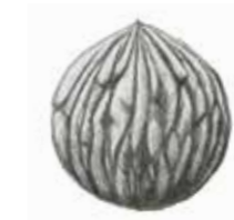
Arizona-Schwarznuss ( Juglans major ).