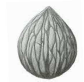
Südliche Walnuss ( Juglans australis ).