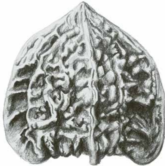
Juglans hopeiensis , eine chinesische Walnuss.