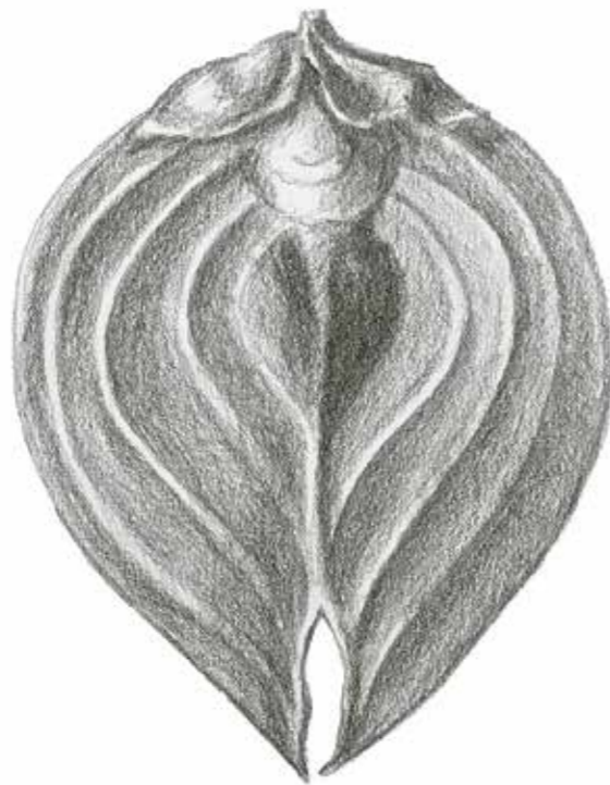
Illustration der Frucht von Rhoiptelea chiliantha , vergrößert.