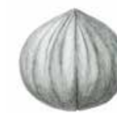
Kalifornische Walnuss ( Juglans californica ).