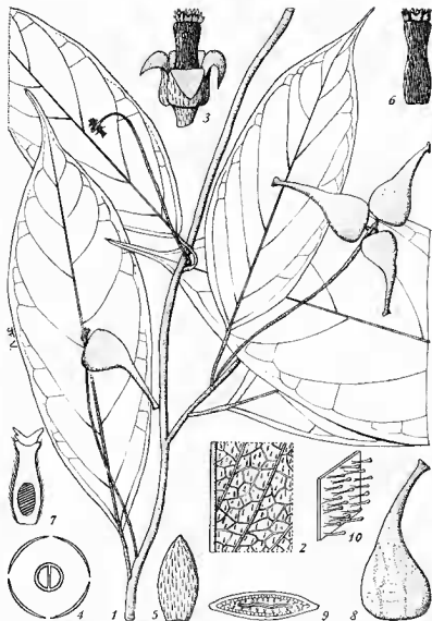
Pl. I. — Pyrenacantha longirostrata Vill. : 1, feuilles, inflorescence ♀ et infrutescences × 2/3; 2, détail de la nervation × 1,5; 3, fleur ♀ × 8; 4, diagramme floral ♀; 5, pétale face extér. × 7,5; 6, pistil × 8; 7, coupe du pistil × 8; 8, fruit × 1,15; 9, coupe du fruit × 2; 10, endocarpe face int.