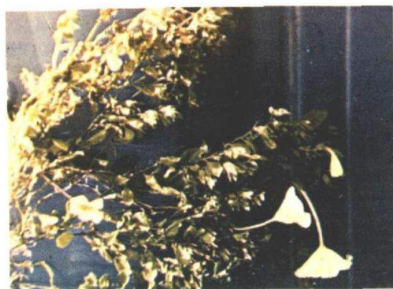
FIG. 3. Nierembergia veitchii que cresceu em um barrenco, protegida pelo pastoreio. Município de Piratini, Rio Grande do Sul.

Estudos epidemiológicos realizados mostraram que a calcemia, nos ovinos que estavam em áreas onde ocorria a calcinose, elevou-se acima dos níveis normais a partir do mês de outubro, mantendo-se alta até fevereiro e começando a diminuir, gradualmente, a partir de março (Riet-Correa et al. 1979a). A elevação dos níveis de cálcio sérico é coincidente com a época em que a planta, devido ao seu ciclo biológico anual, encontra-se nos poteiros.