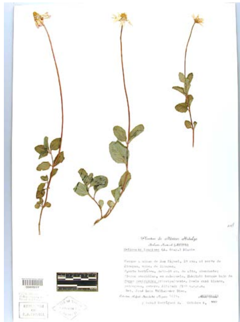
Especimen de Herbario del New York Botanical Garden en el Herbario virtual de Conabio: http://www.conabio.gob.mx/otros/cgi-bin/herbario.cgi