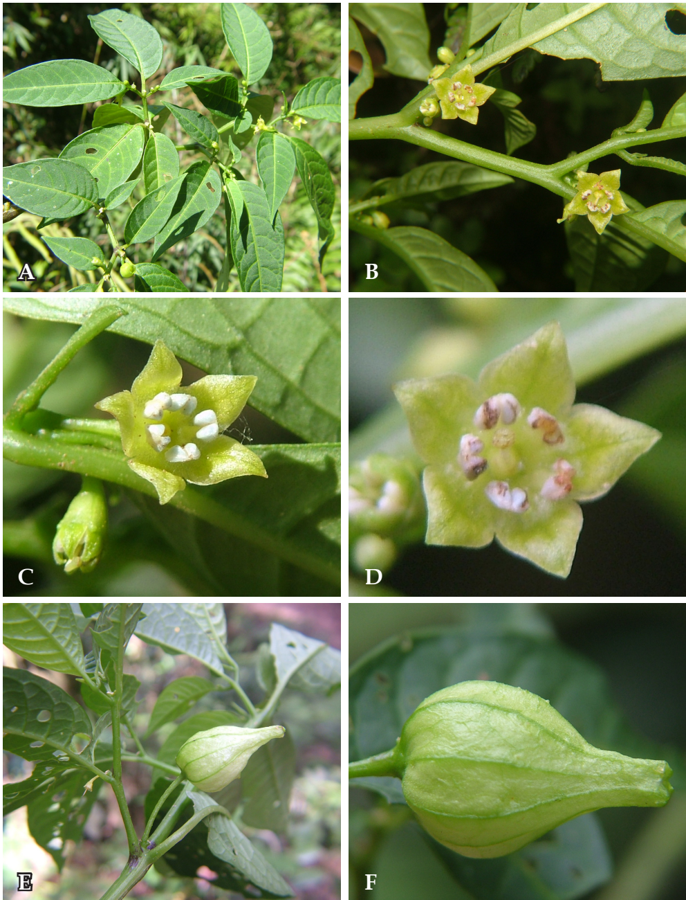
Fig. 3. Deprea longicalyx E. Rodr., S. Leiva & J. Campos. A. Rama florífera; B. Detalle, rama florífera; C. Flor en antesis, vista ventral; .D. Flor en antesis mostrando las anteras maduras y la longitud del estilo-estigma; E-F. Fruto, nótese la longitud del ápice del cáliz fructífero. De: A, C, E: E. Rodríguez et al. 2780 (HAO, HUT, LOJA, MO, QCNE, USM); B, D, F: E. Rodríguez et al. 3056 (HAO, HUT, LOJA, MO, QCNE, USM).