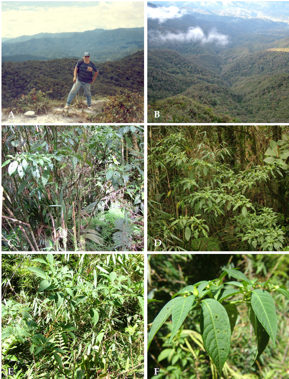
Fig. 2. Deprea longicalyx E. Rodr., S. Leiva & J. Campos. Habitat y hábito. A. Vista de la localidad de Nuevo Mundo desde El Mirador ubicado en la cordillera Huarango (julio 1997); B. Nótese la localidad de Nuevo Mundo constituida de la denominada selva andina, hábitat natural de la nueva especie (abril 2006); C-E. Hábito arborescente y arbustivo; F. Rama florífera. De: C y F: E. Rodríguez et al. 2780 (HAO, HUT, LOJA, MO, QCNE, USM); D: E. Rodríguez et al. 3056 (HAO, HUT, LOJA, MO, QCNE, USM); E: E. Rodríguez 1979 (HUT, MO, USM).