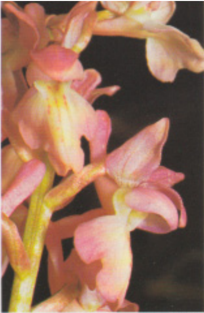
Fig. 4 : Orchis x loreziana