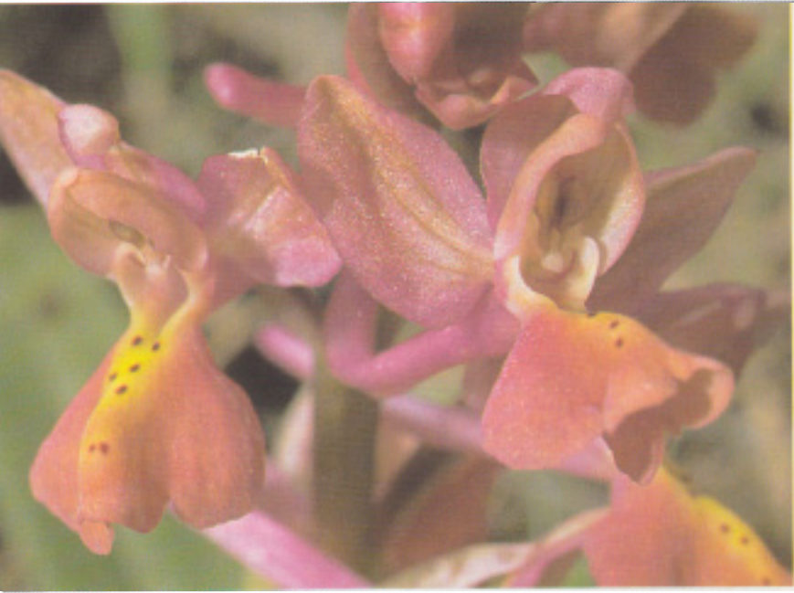
Fig. 3 : Orchis x thriftiensis