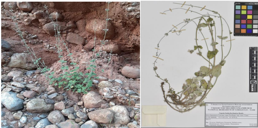
1-rasm. Nepeta badachschanica Kudr. Surxandaryo Viloyati Boysun tumani Sina qishlogi N 67.661124. E 38.388648.

3,5 sm uzunlikda, cheti tishsimon-to'liqsimon qirqilgan, ikkala tomonidagi aniq bortmagan tomirlar bilan abaksial kuchli ajinlangan, zich oq tuklar bilan qoplangan; bandi zich oq tukli, uzunligi 1,2-4 sm. Verticillasterlari 1 sm dan uzun ostki gultumshuqlariga ega, ustki qismi 0,3-0,5 sm uzunlikda; gul barglari poya barglariga o'xshash, plastinkasining uzunligi 7-8 mm; bandining uzunligi 5-6 mm; eng yuqori qismidagi gul barglari ingichka, chetlari butun, lansetsimon-chiziqsimon, 5-6×1 mm o'lchamda, poyaga otirgan holda joylashgan, oq tukli; guloldi barglari gulkosaning yarmidan qisqaroq, zich tukli, yuqoriga qayrilgan; gulo'qi meva berishda diametri 8-15 mm ni tashkil etadi, 6-8 guldan iborat. Gulkosa quvursimon, ikki labli, bandsiz yoki juda kalta bandli, 13 tomitli. Yuqori labi juda kalta, yuqori lab uch tishli; lansetsimon tishlari quvursimondan 2 marta kalta, pastki lab ikki bo'lakli, tishlari yuqorigisidan 1,5 marta kalta. Gul kosachasi 7-8 mm, meva kosasi 9-10 mm, zich tukli. Gultojibargining uzunligi 12-13 mm; tojibarglar kosachabarglardan biroz uzunroq va kosachabargdan biroz chiqib turadi. Gultojibargning yuqori labi ikki bo'lakli, oval, tashqi tomondan tuklangan, pastki bo'lagi uch qirrali, yon bo'laklari yarim doira, uchburchak, o'rta bo'lagi ancha kengroq, chetlari qirqilmagan.