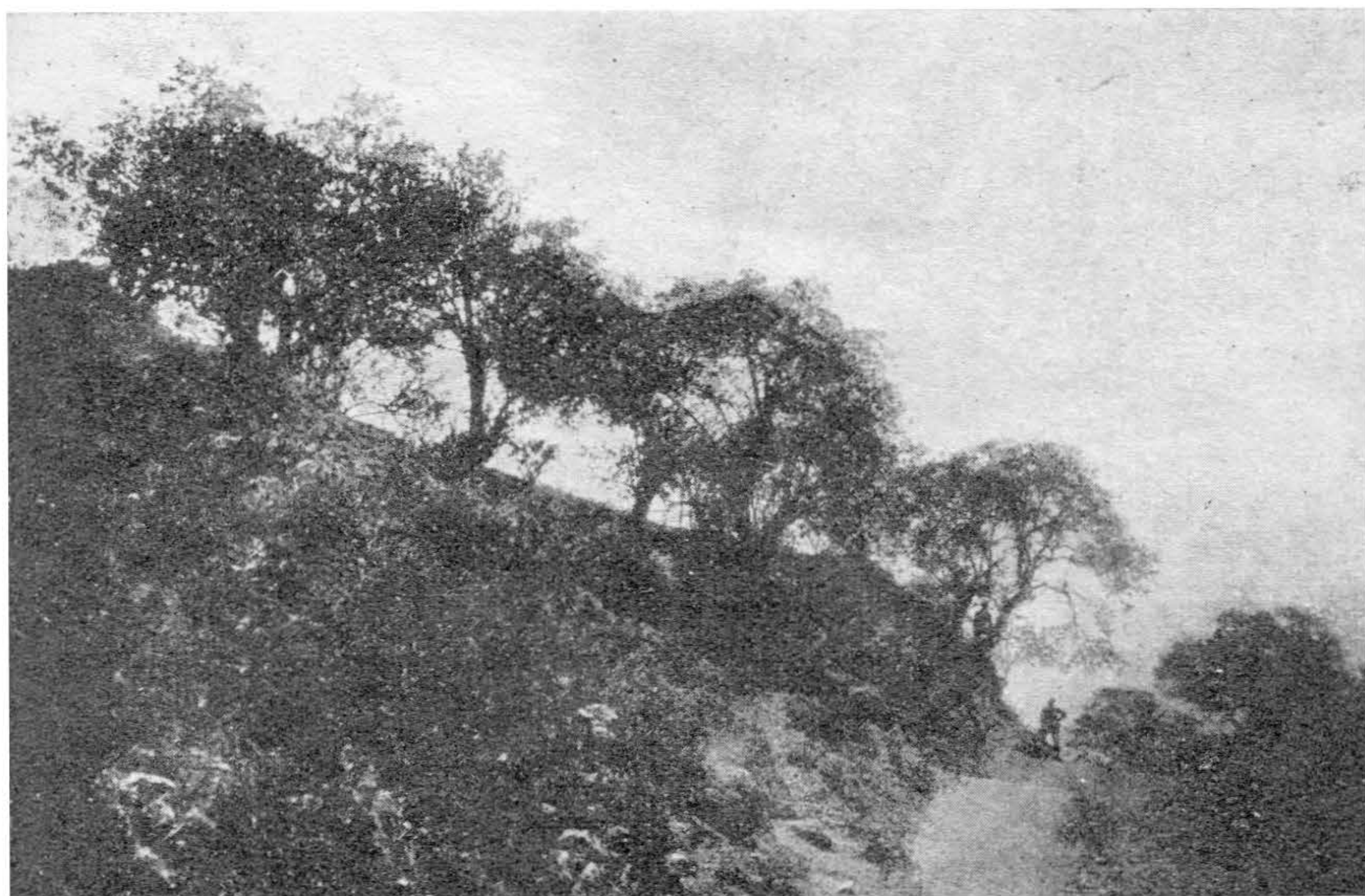
Fig. 6.—Un grupo de árboles de Escallonia resinosa (Chachacuma) en la Hacienda Chari, a 3,200 metros sobre el nivel del mar.

En las partes altas, que son las más inmediatas a la ciudad, se desarrollan poco y sus frutos nunca llegan a la madurez; no así en los terrenos de la hacienda Okari, particularmente en el llano bastante húmedo, en que la planta adquiere su máximo desarrollo, cubriéndose en esta estación de grandes racimos de frutos rojos, que presentan el más bello aspecto.