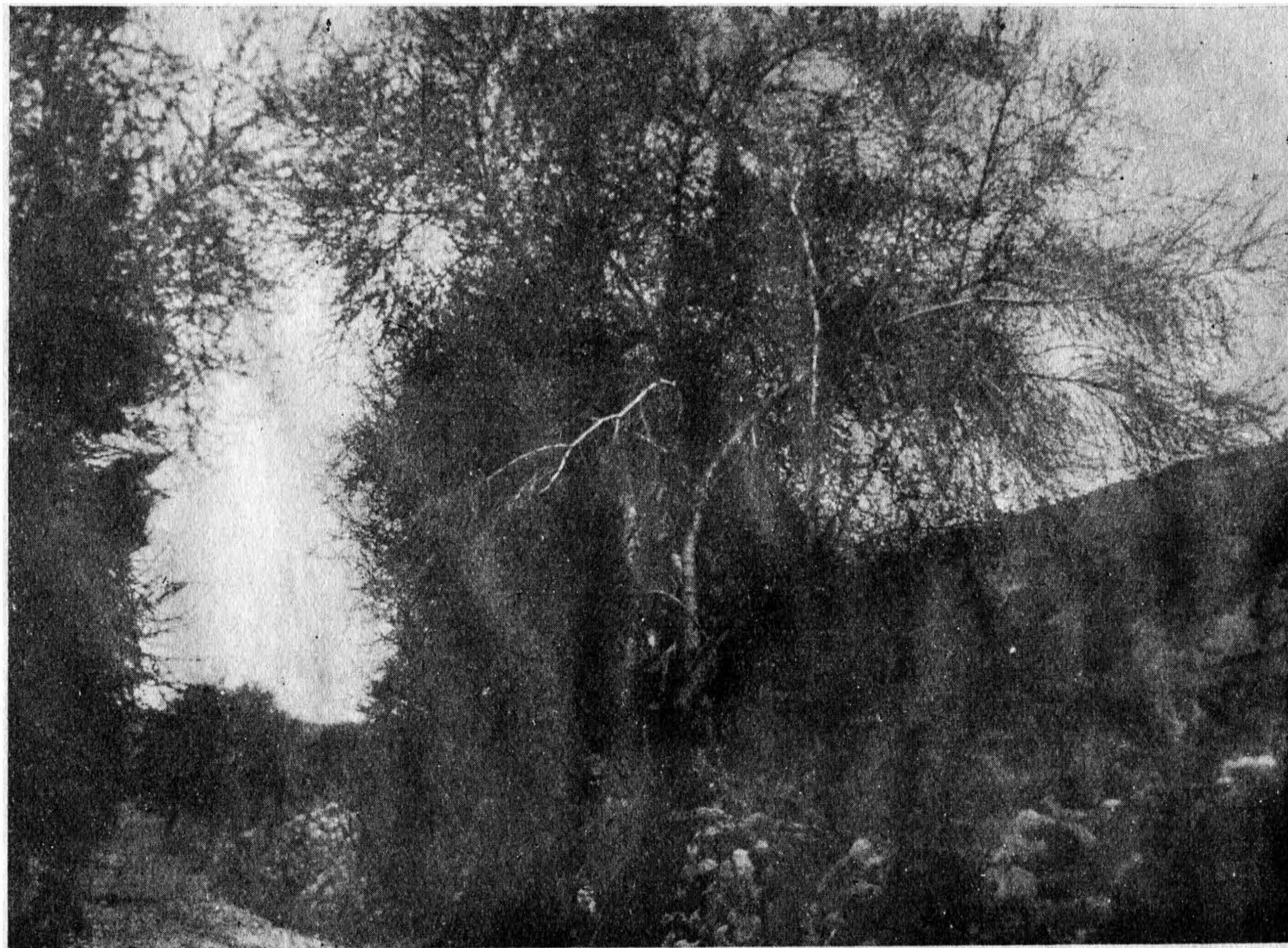
Arbusto de Citharexylum Herrerae , Mansf. Sin. vulg. Huairuru. Reg. Cuzco, Hacienda Chari a 3,200 metros sobre el nivel del mar.