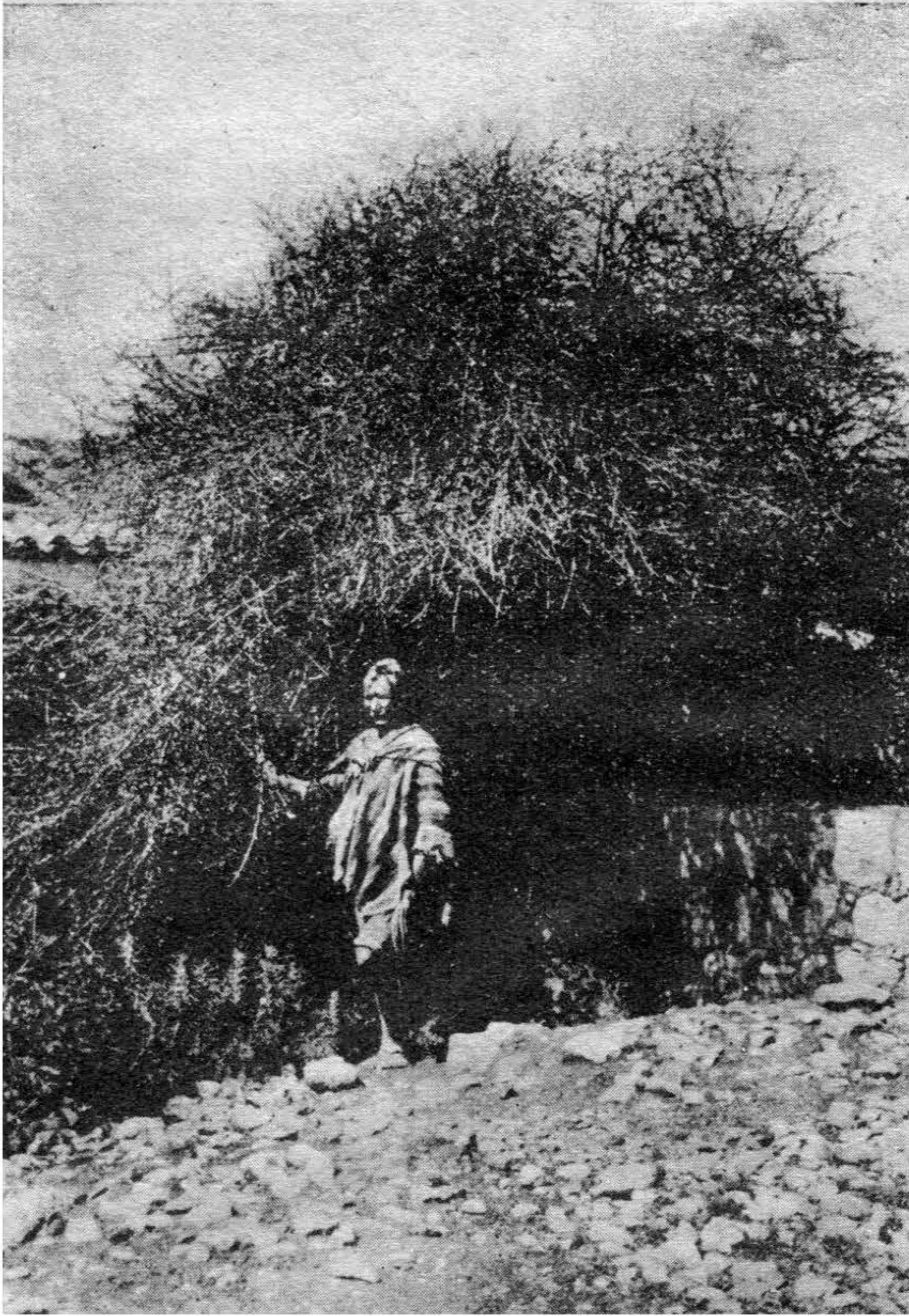
Fig. 5. —Arbusto de Citharexylum Herrerae , presentando su vástago muy ramoso. Hacienda Chari, a 3,200 mts. sobre el nivel del mar

de lluvias, que en el Cuzco corresponde a la estación de verano. Las especies indígenas con que está asociado son las siguientes: El Escallonia resinosa (Chachacuma) muy abundante en las proximidades de la quebrada de Miska-huara; el Parosela boliviana var. Herrerae