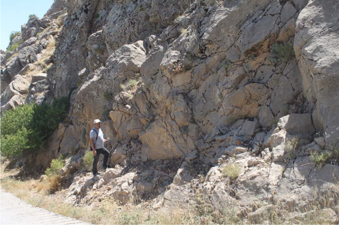
Fotoğraf 14. Rosularia blepharophylla Yaşam Alanı (Makamdağı, Nevzat Çiftçi-DKMP)